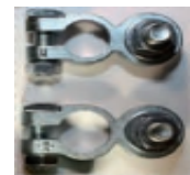
Accessoire en option