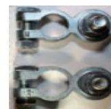
Accessoire en option